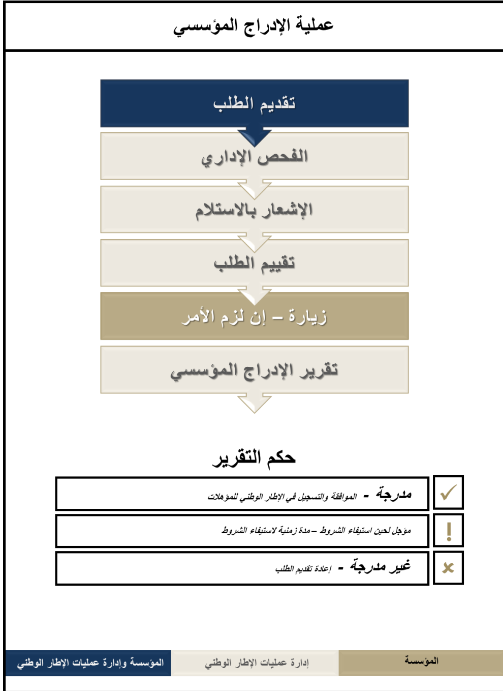
شكل رقم: 4 - عملية الإدراج المؤسسي