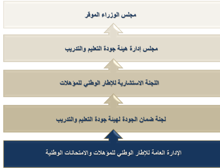
شكل رقم: 1 - حوكمة الإطار الوطني للمؤهلات