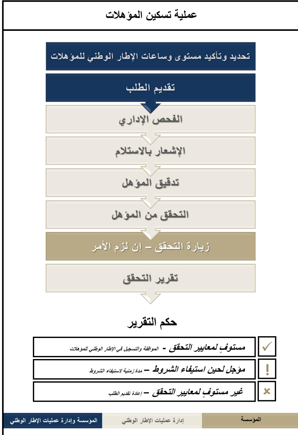
شكل رقم: 5 - عملية تسكين المؤهلات