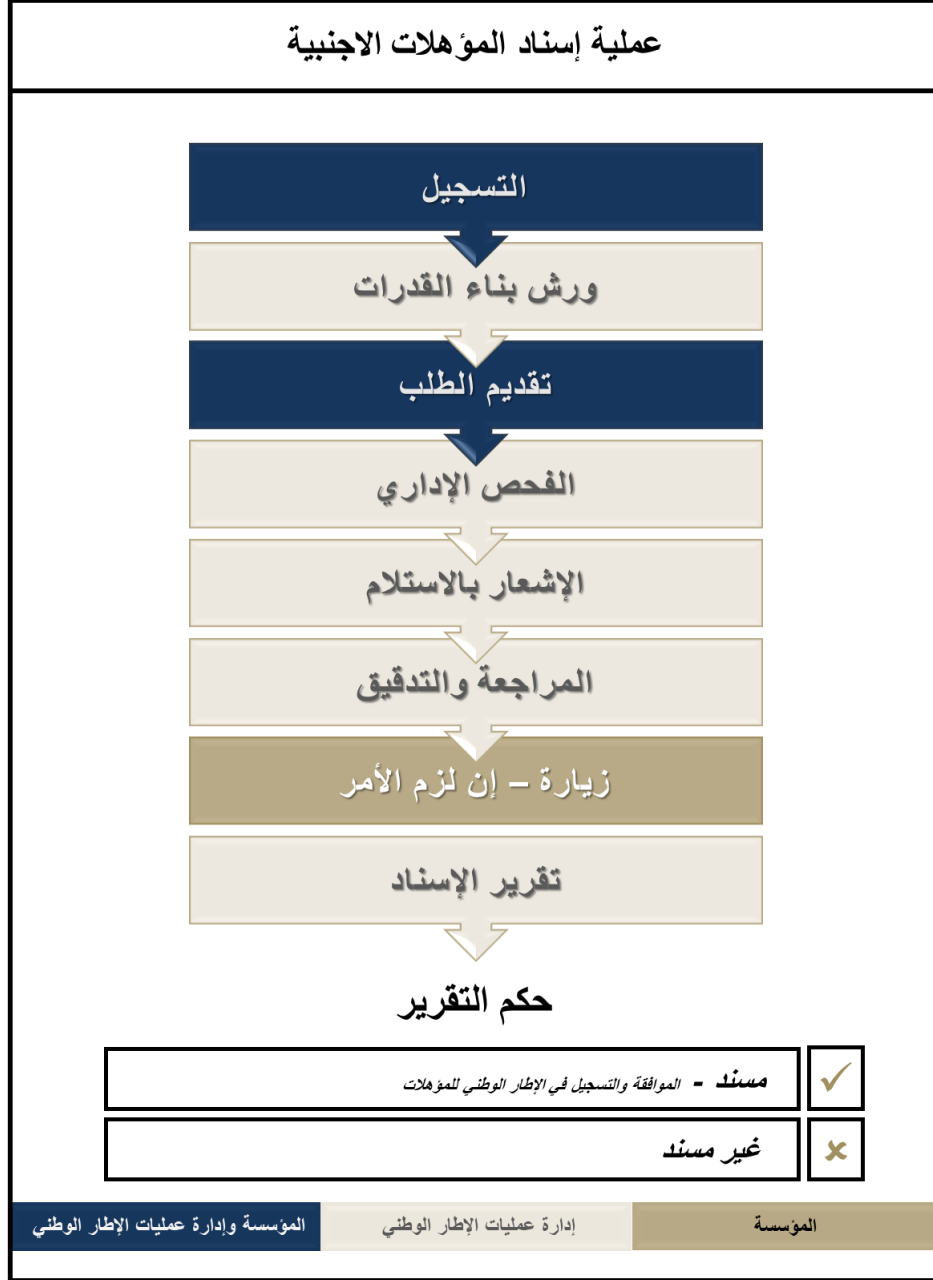
شكل رقم: 6 عملية إسناد المؤهلات الأجنبية