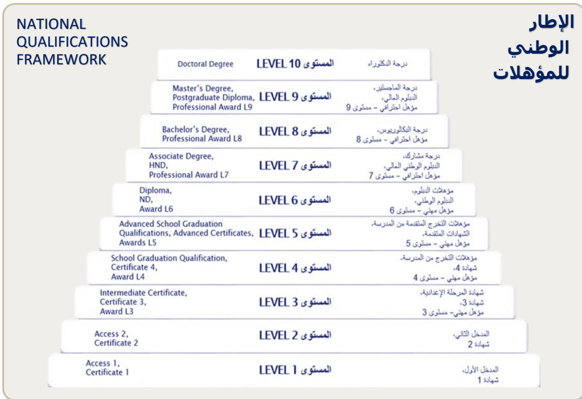
شكل رقم: 3 - هيكل مستويات الإطار الوطني للمؤهلات